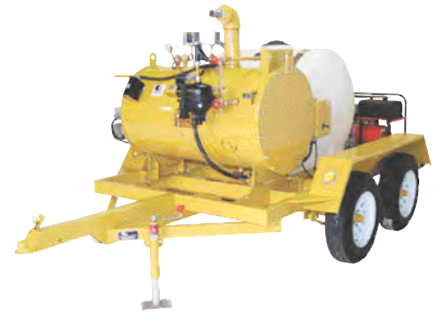
Modelo SF-11 autocontenido, alimentado a petróleo, con tanque de agua, generador y remolque apto para autopistas