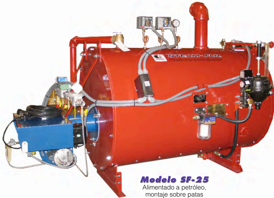
Modelo SF-25 Alimentado a petróleo, montaje sobre patas

168 a 383 kg (370 a 845 lb) por hora de vapor saturado, en minutos • Vapor continuo, sin límite • Operación simple • Fácil mantenimiento • Hechos para durar