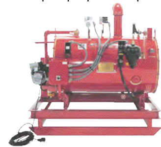
SF-11 montado sobre bastidor, alimentado a petróleo