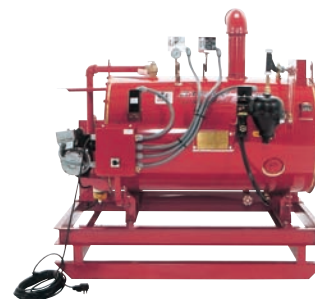
Modèle SF-11 monté sur patins, au mazout