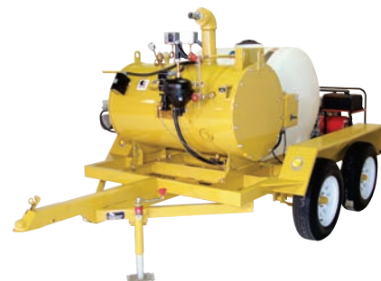
Modèle SF-11 autonome au mazout, avec réservoir d'eau, générateur et remorque pour route